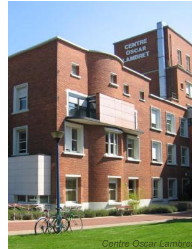
Centre Oscar Lambret