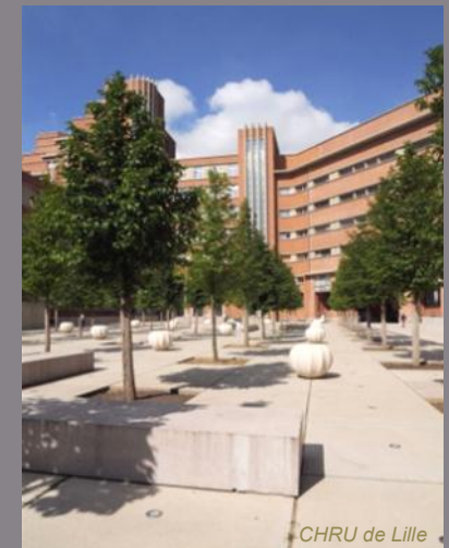
CHRU de Lille